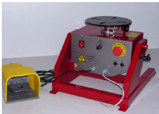
Kapasitet 100 Kg. Power 66