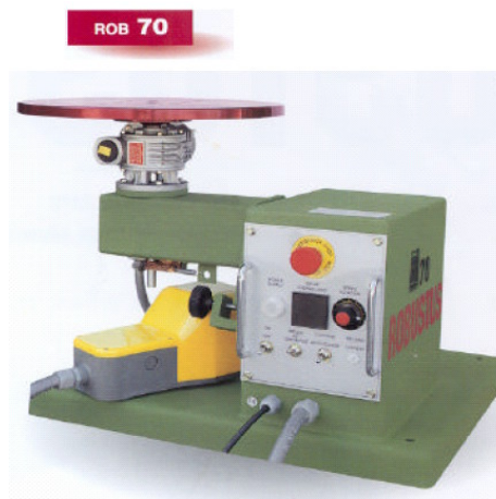
Kapasitet 70 Kg. Rob 70 med horisontal plate Rob 70/S 360° automatisk rundsveis me