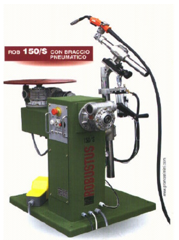
Kapasitet 150 Kg. Rob 150/S med pnaumatisk controlert sveispistolarm