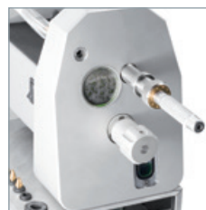
Drej håndtaget for at afkorte elektroden